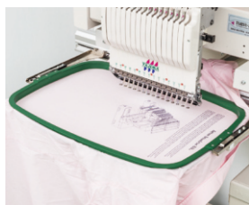
▲ Trubkové rámečky