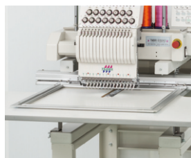
▲ Bordurový rám