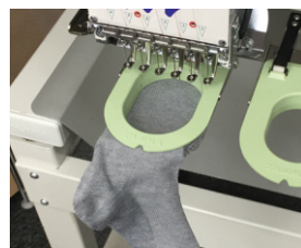
▲ Rámečky na ponožky