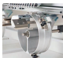
Nový Čepicový Rám