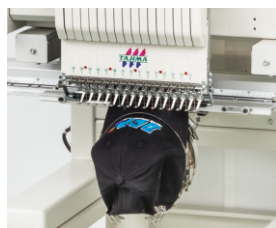
▲ Čepicové rámečky