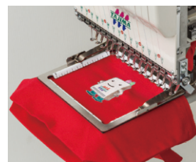
▲ Pneumatický rám